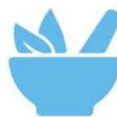
Legno & Spezie